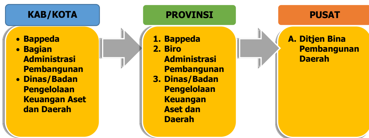
Gambar 1.1 Proses umum rancangan usulan DAK Fisik

Proses pengusulan dan verifikasi rancangan usulan program dan kegiatan pembangunan daerah melalui dana alokasi khusus fisik dilakukan secara berjenjang dari awal penginputan rancangan pengusulan kegiatan Dana Alokasi Khusus (DAK) Fisik oleh perangkat daerah sampai dengan verifikasi daerah kabupaten/kota dan daerah provinsi sampai dengan di tingkat pusat melalui Direktorat Jenderal Bina Pembangunan Daerah. Verifikasi yang dilakukan pada tiap level pemerintahan dilakukan dengan menggunakan indikator yang telah ditentukan, sehingga output verifikasi dari tiap tingkatan dapat akan berbeda sesuai dengan kebutuhan masing-masing. Proses umum verifikasi rancangan usulan program dan kegiatan pembangunan daerah melalui DAK fisik secara keseluruhan meliputi: